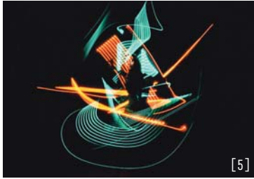
© CHEN YIN-LI HUANG HSIN-I SEI-YU JUNG