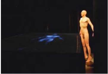
© MALVINA DELESALLE & MARTINE GABRIELE